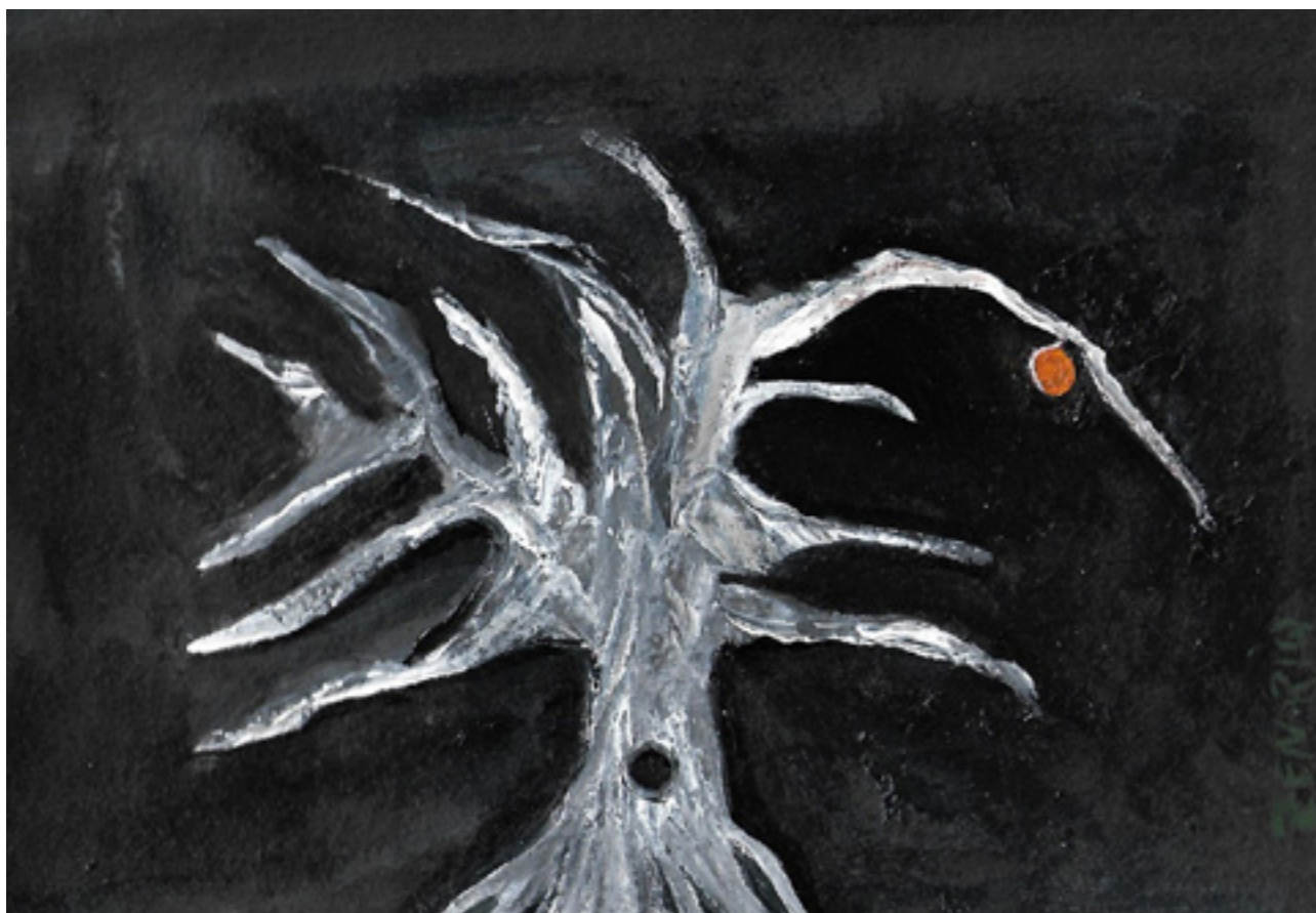
A cura Acrílica sobre cartão, formato A4, 2022