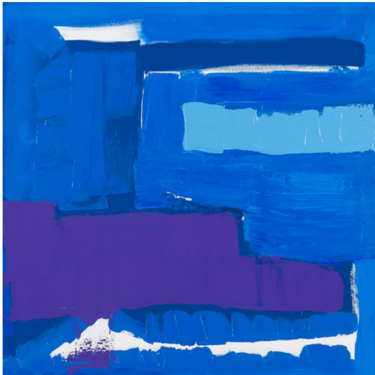
Mar acrílica sobre tela, 2012 (100x100 cm)